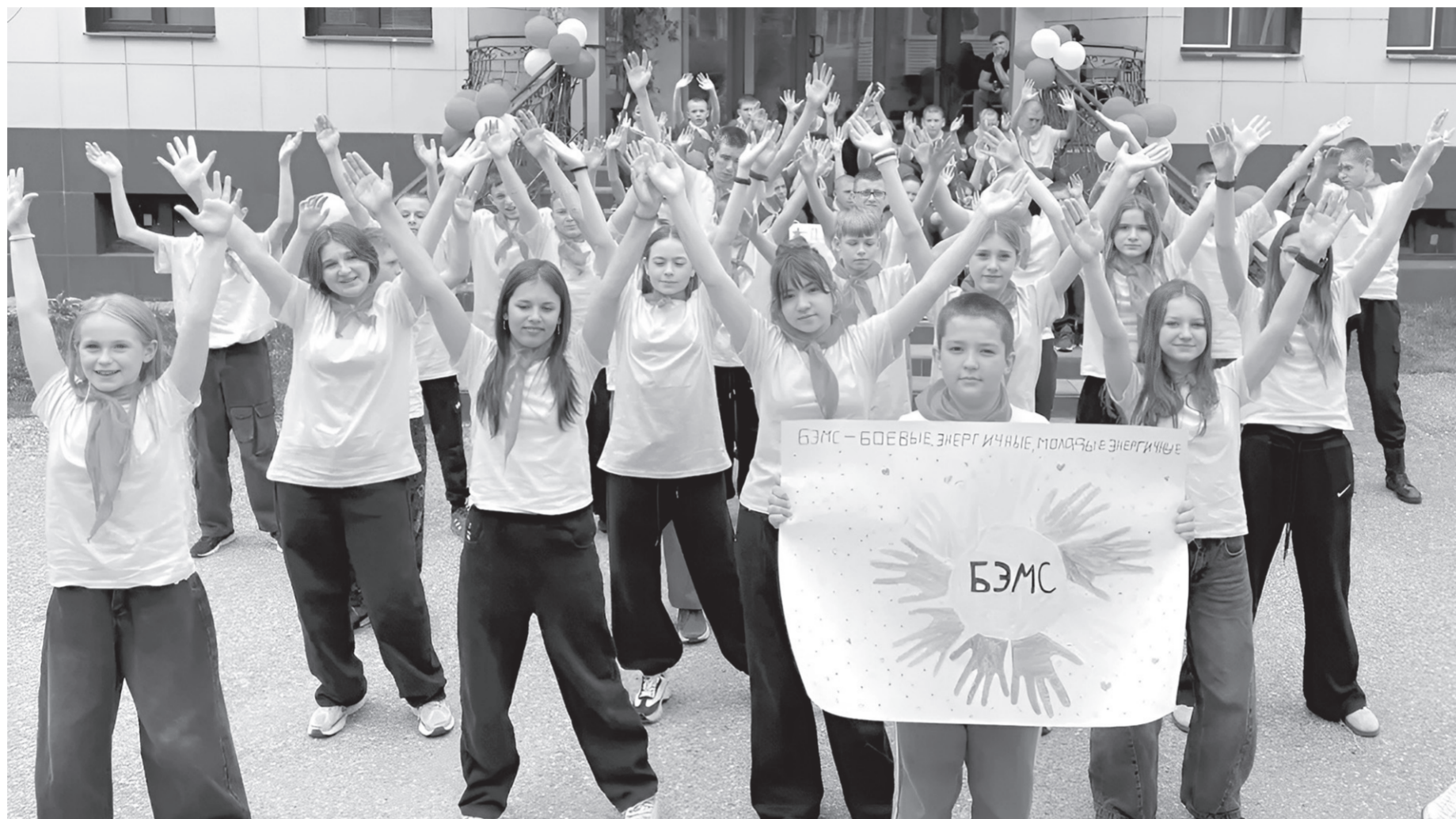
Скучать в «Гранд-Виктории» никому не приходится

Так и происходит. Несмотря на долгий переезд, уже первый день пребывания в Домбае стал для детей из Старобельского округа настоящим подарком. После сытного ужина прошел зажигательный танцевальный батл, где ребята продемонстрировали свои хореографические таланты и чувство ритма. Накал страстей продолжился на дискотеке, но на этом сюрпризы дня не закончились. Кульминацией вечера стали волшебный фейерверк, традиционные отрядные свечи и уютный костер, за которым в теплой дружеской атмосфере ребята делились своими мыслями и мечтами.