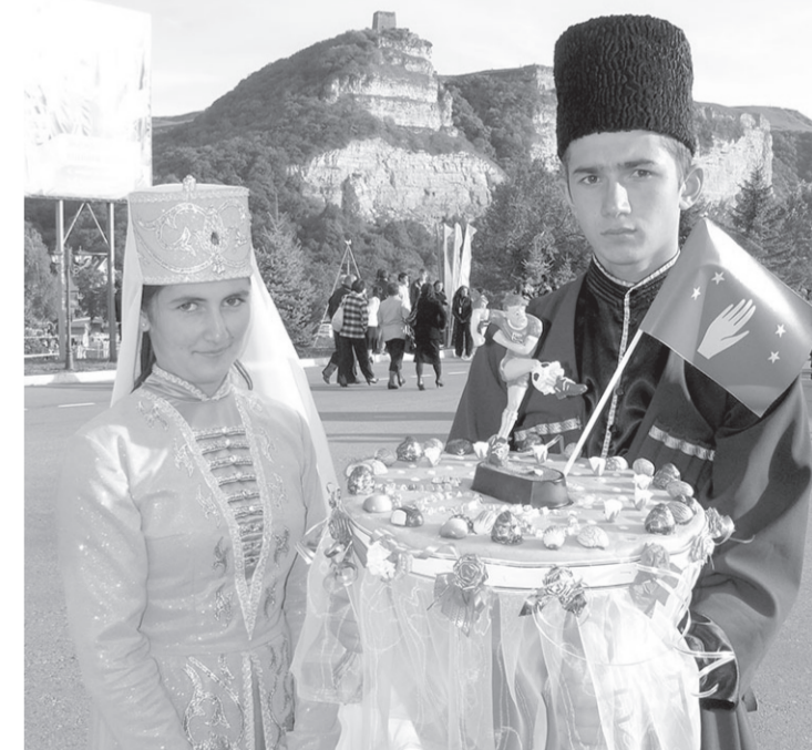
Гостеприимство — одна из значимых традиций абазинского народа

— Ну, не все же события прошлых лет были трагическими... — Нет, разумеется. В 2001 году был создан Абазинский драма-