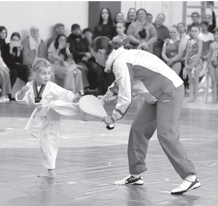
Показательные выступления на фестивале «Выбирай спорт!»